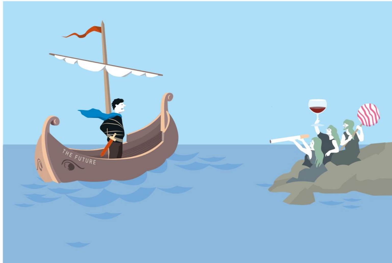
Illustration: ©Johan Jarnestad/The Royal Swedish Academy of Sciences