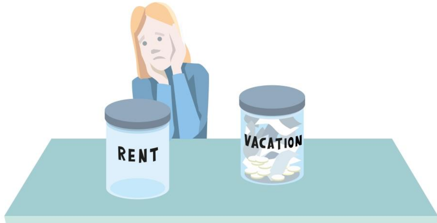
Illustration: ©Johan Jarnestad/The Royal Swedish Academy of Sciences