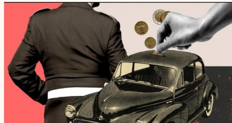
▲ Illustrazione di Laura Cattaneo/Il Sole 24 Ore